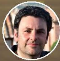
GM Oscar de la Riva